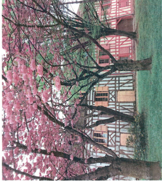
Fachwerkhäuser in Troyes

Best Western Hôtel de la Poste 35 Rue Emile Zola F-1000 Troyes Tel. +33 3 25 73 05 05